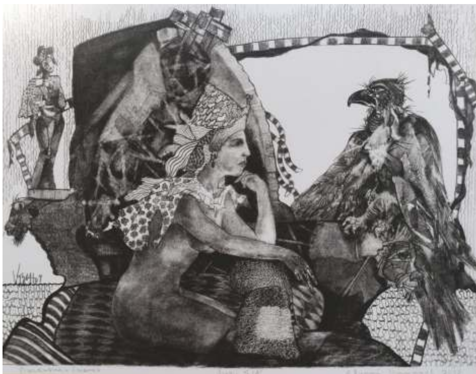
„Византия“ литография 28x32 см.

Завършил НХА – София, спец. Скулптура. Работи в областта скулптурата, монументалната пластика, графиката и живописа.