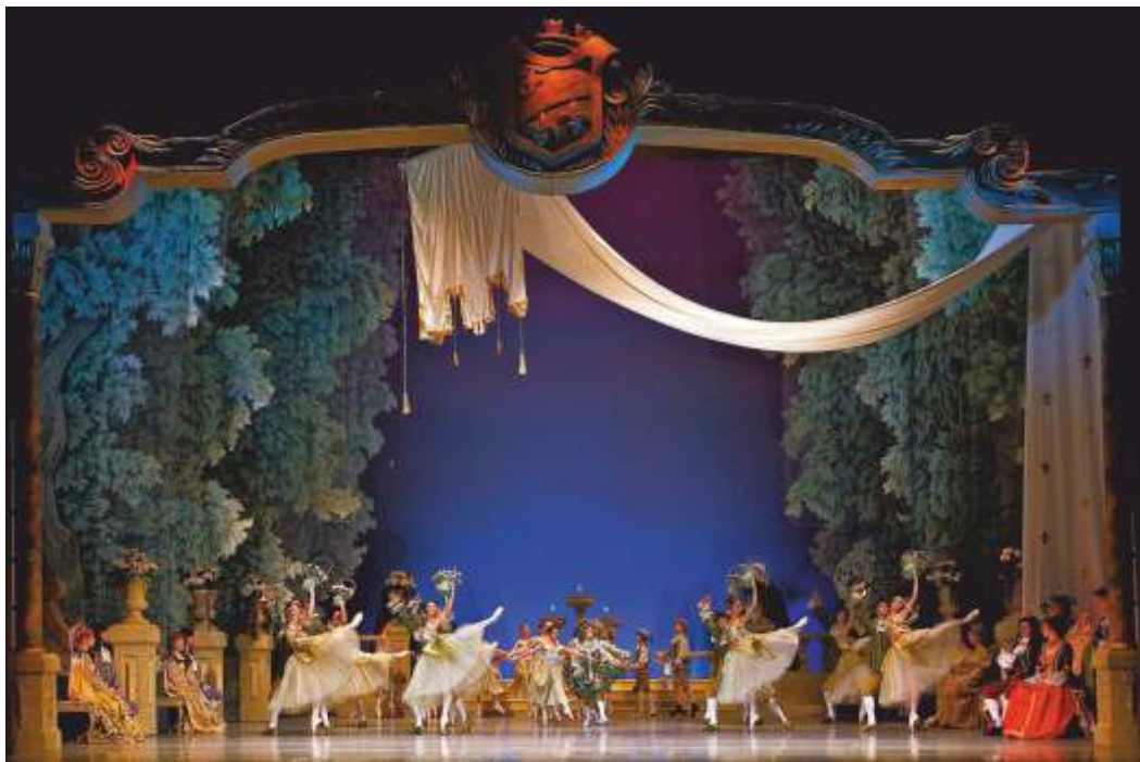
Костюми към „Спящата красавица“, постановка на Софийска опера и балет