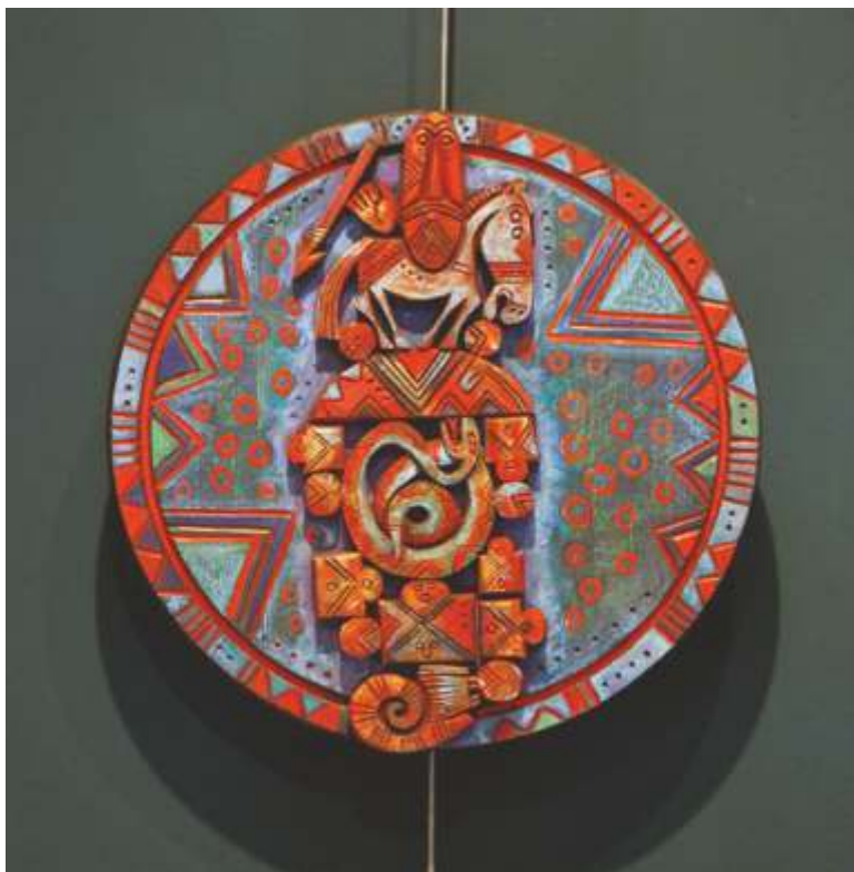
„Память II” оцветено дърво, 80x80 см.

Завършил НХА – София, спец. Дърворезба. Работи в областта на дърворезбата.