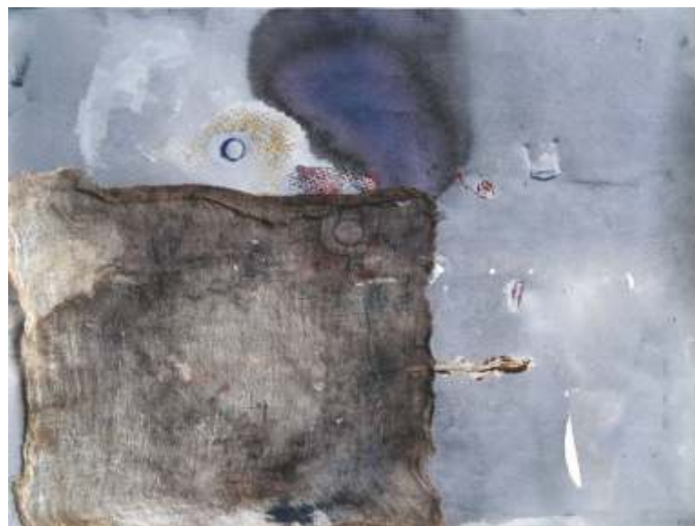
„Композиция” см. техника, 34x38 см.

Завършила НХА – София, спец. Живопис и докторат в НБУ. Работи в областта на живописа и керамиката.