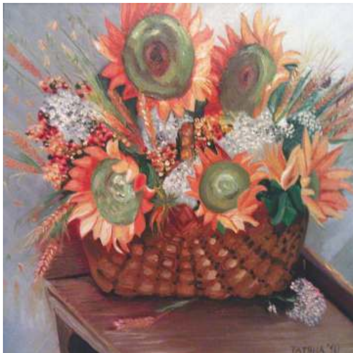
„Слънчогледи” м.б., 46x46 см.

Завършила ЮЗУ „Н. Рилски” – Благоевград. Работи в областта на живописта и модата.