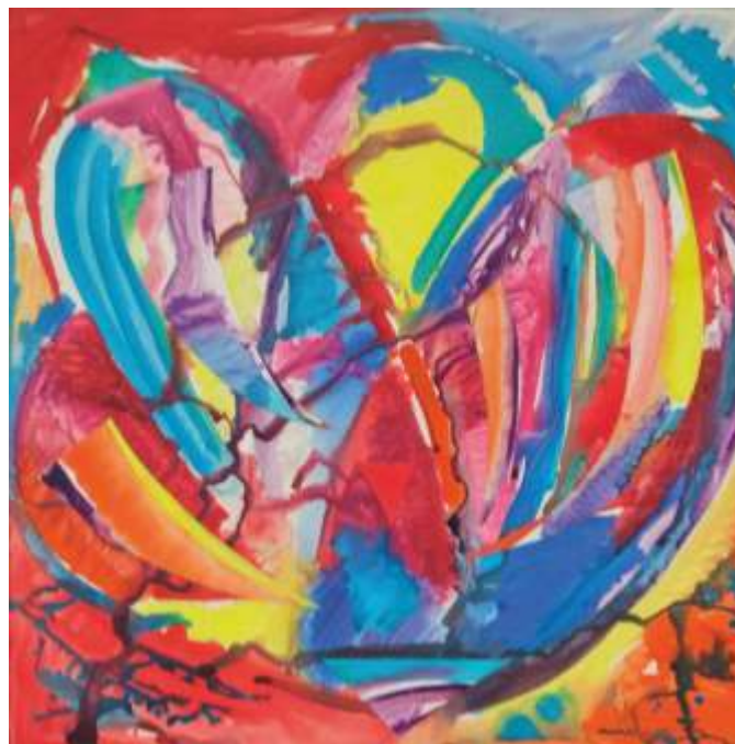
„Цвете“ акрил, 80x80 см.

Завършила ВТУ „Св. св. Кирил и Методий“ – В. Търново, спец. Живопис. Работи в областта на живописа.