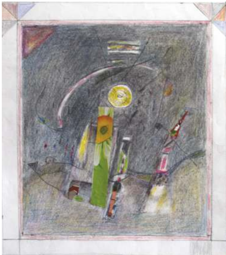
„Рисунка“ см. техника, 16,5x17,5 см.

Завършил в НХА – София, спец. Живопис. Работил в различните жанрове на живописата – портрета, композицията и рисунката.