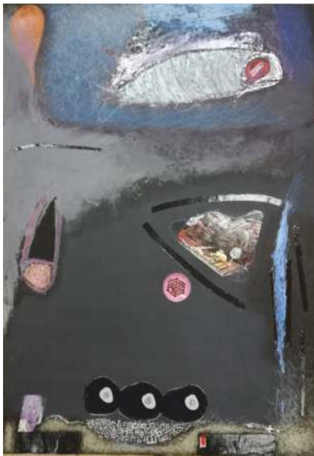
„Композиция“ II см. техника, 100x70 см.

Завършил ВТУ „Св. св. Кирил и Методий“ – В. Търново, спец. Скулптура. Работи в областта на живописта, приложната графика и скулптурата.