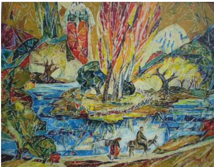
„Край реката“ м.б., 45x65 см.