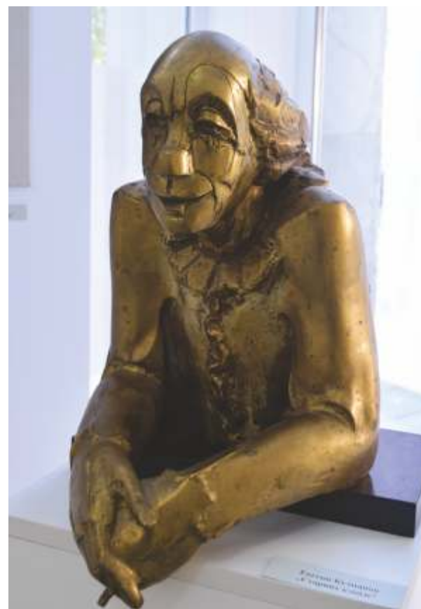
„Старият клоун“ месинг 50x35x30 см.