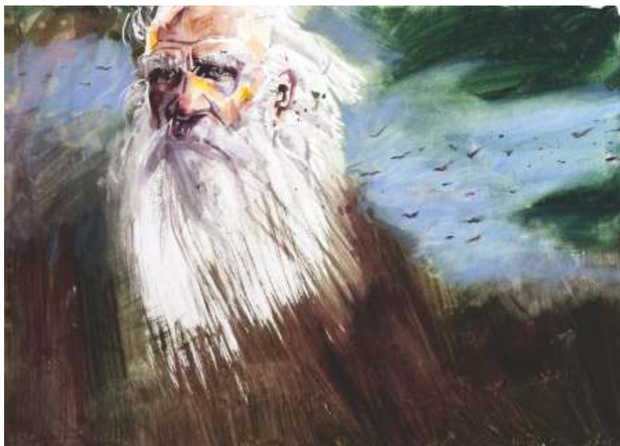
„Толстой” м.б., 76x58 см.

Завършил НХА – София, спец. Плакат. Работи в областта на живописта и приложната графика.