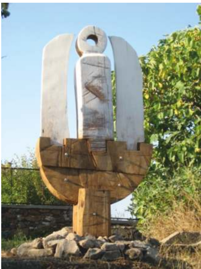
„Пластика“ камък, дърво, 147x135x124 см.

Завършил в НХА – София, спец. Скулптура. Работи в различните жанрове на скулптурата, експериментира с различни материали и изразни средства.