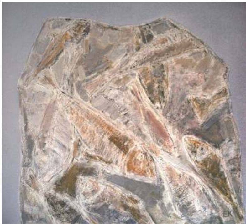
„Палеозой“ м.б., 60x66 см.

Заместник декан на Факултета по изкуствата и ръководител катедра „Изобразително изкуство“. Завършил ВТУ „Св. св. Кирил и Методий“ – В. Търново, спец. Живопис. Работи в областта на живописта, педагогиката, теорията и историята на изкуството.