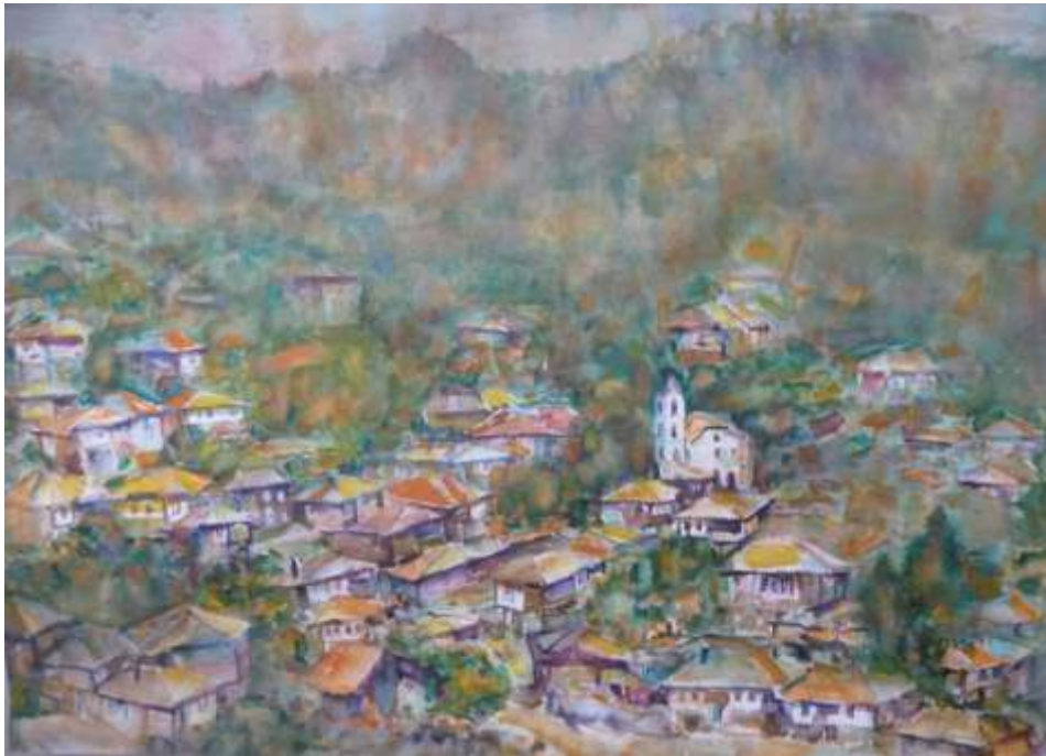
„Ковачевица“ акварел, 50x70 см.

Завършил в НХА – София, спец. Графика. Работи в областта на живописта, графиката, акварела и монументалните изкуства.