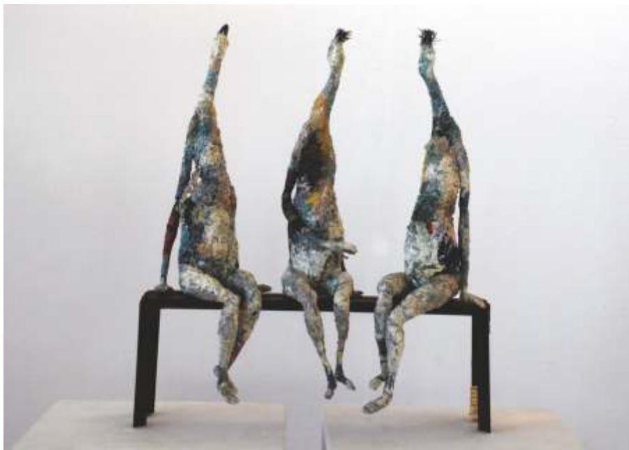
„Три“ см. техника 10x41x45 см.

Работи в областта на скулптурата и концептуалните изкуства.