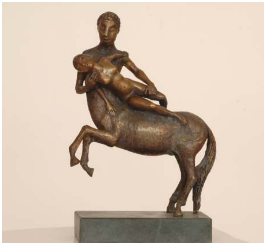
„Кентавър“ бронз, 38x32x19 см.

Завършил в НХА – София, спец. Скулптура. Работил в областта на скулптурата, малката пластика и живописа.