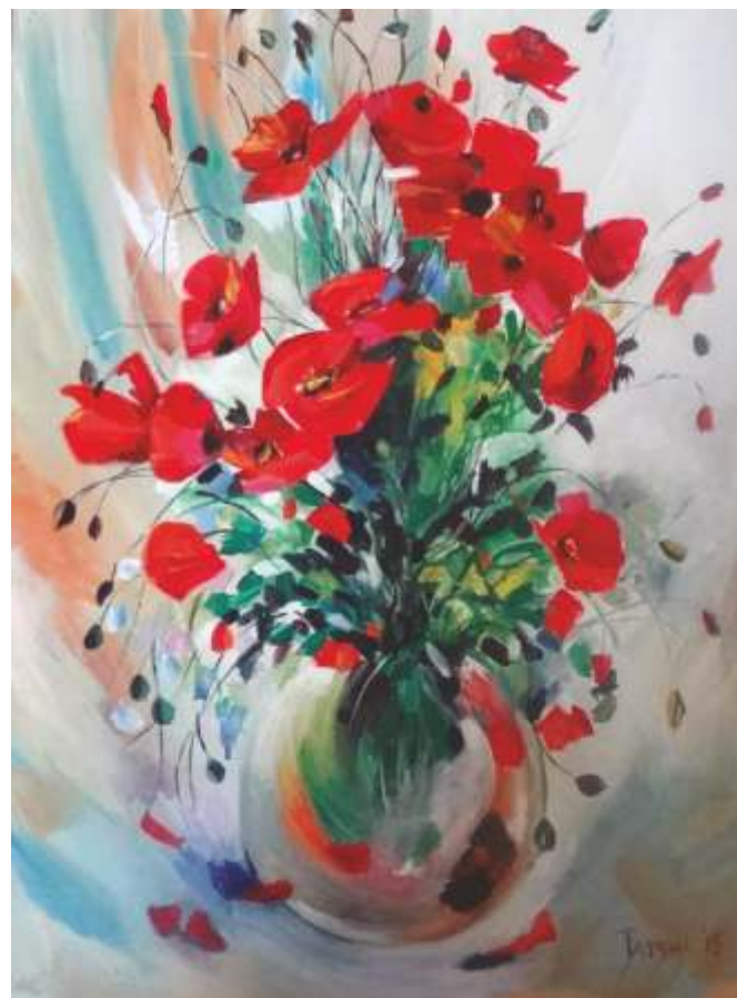
„Макове” м.б., 50x35 см.