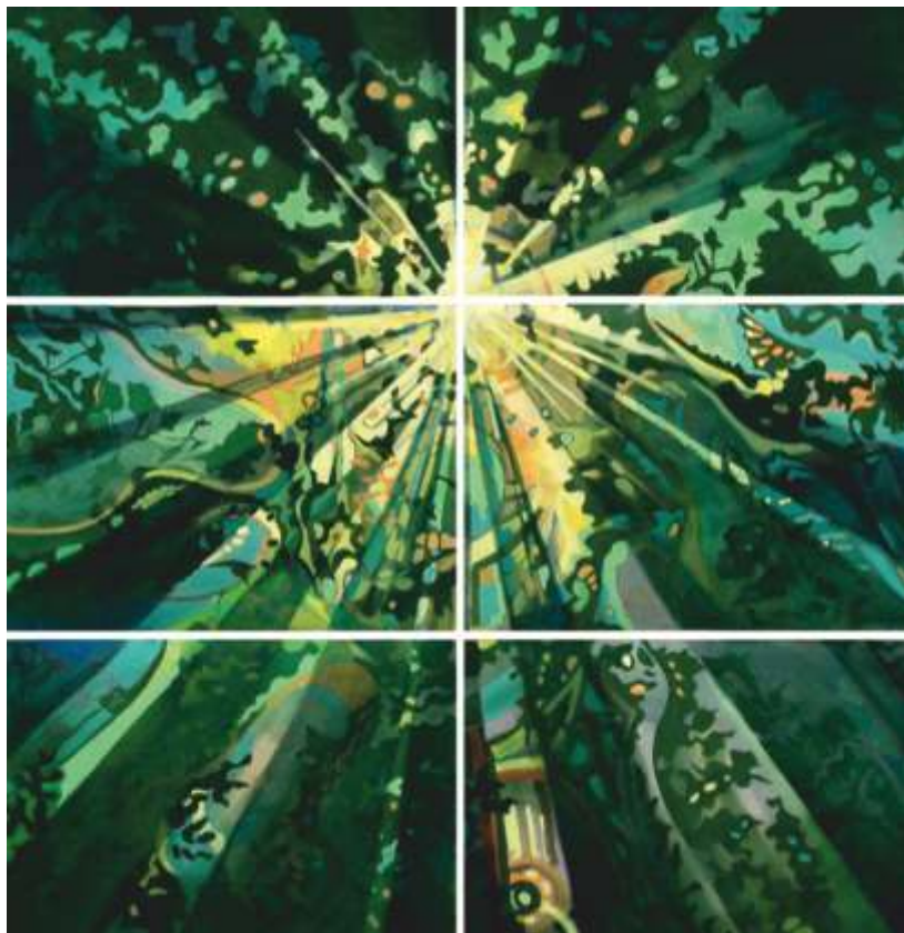
„Композиция“ м.б., 150x152 см.