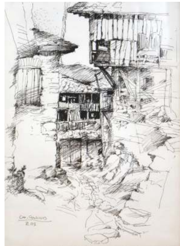
„От Ковачевица“ рисунка, перо и туш 50x35 см.