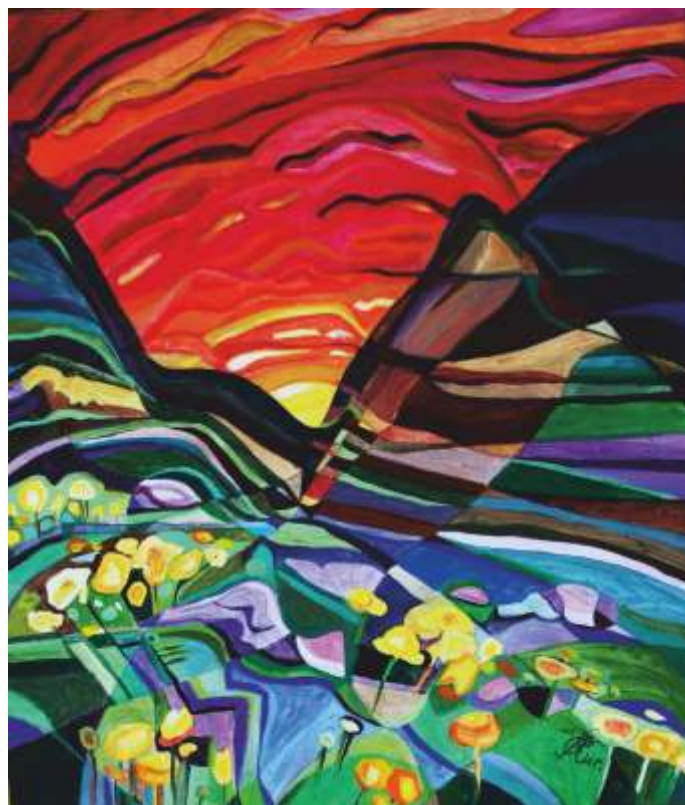
„Залез“ акрил върху платно 60x72 см.