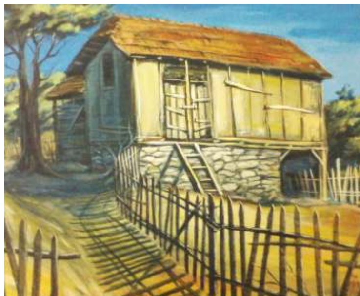
„Стара къща” см. техника, 34x45 см.

Завършил ЮЗУ „Н. Рилски” – Благоевград. Работи в областта на графиката и графичните техники.