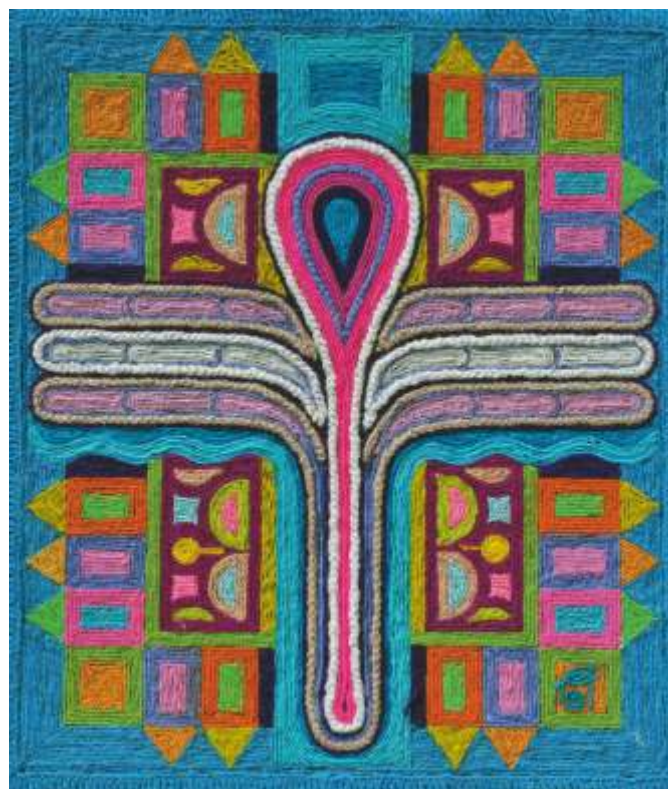
„Композиция“ I колаж, текстил 80x70 см.