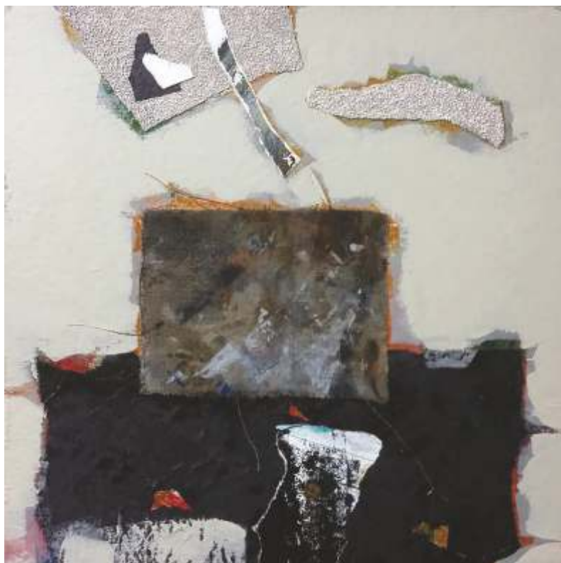
„Колаж“ см. техника, 50x50 см.