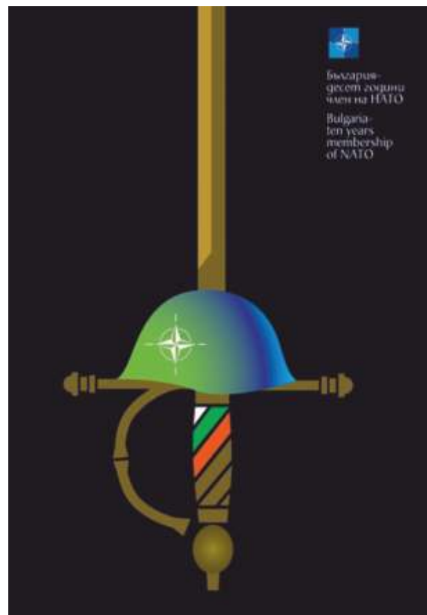
Плакат, 100x70 см.