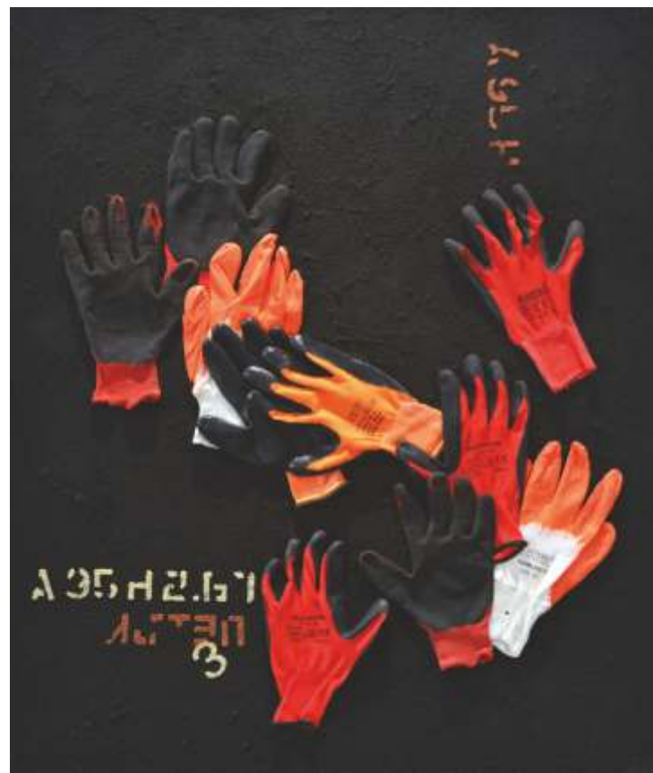
„Композиция” см. техника, метал, предмети 140x120 см.