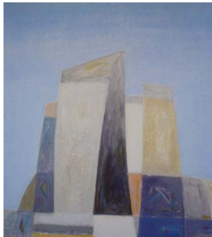
„Кули“, м.б., 77x70 см.