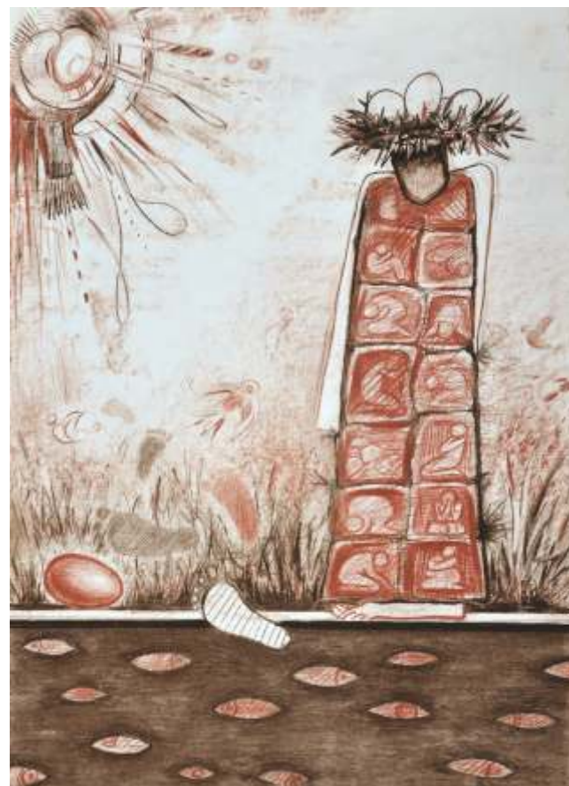
„В търсене на другото“ см. техника, 54x47 см.