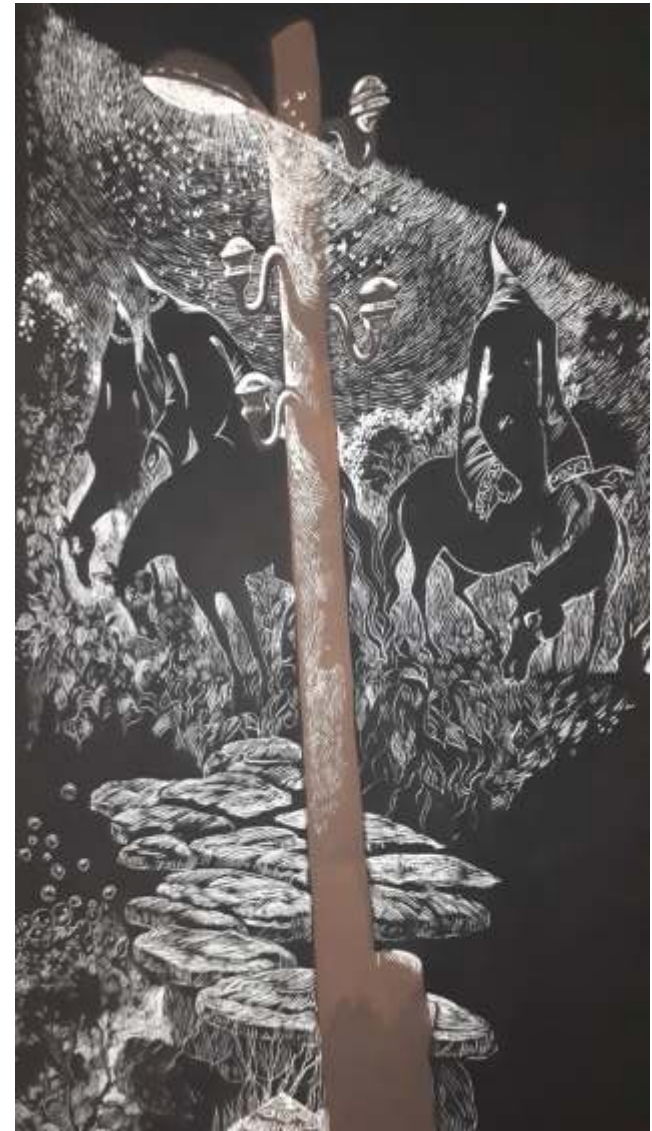
„В цирка“, кредов картон, 25x45 см.