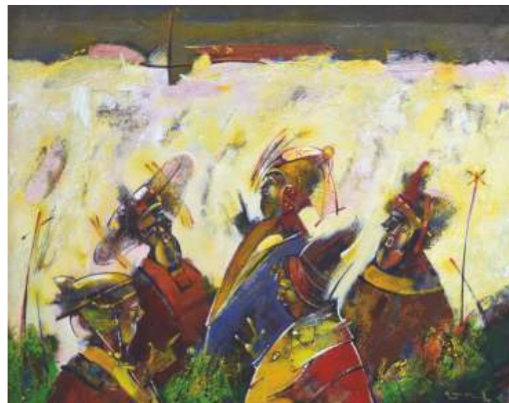
„Притча“, акрил, 50x60 см.

Завършил в НХА – София, спец. Стенопис. Работи в областта на живописта, рисунката и монументалните изкуства.