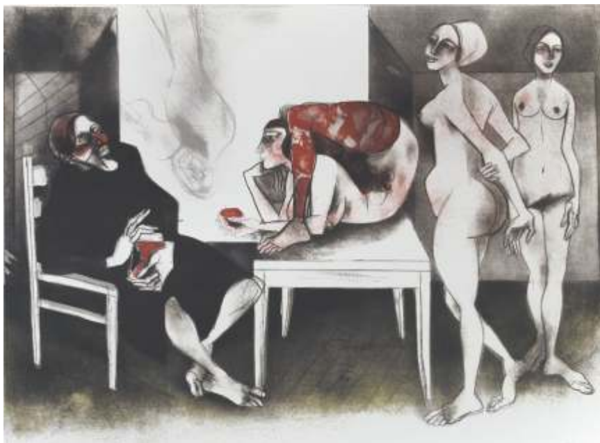
„Парис“ литография, 65x46 см.