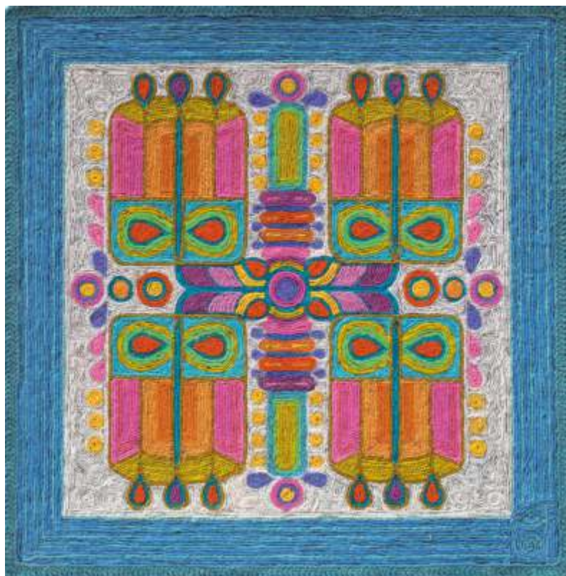
„Композиция“ II колаж, текстил 80x80 см.

Завършила ВТУ „Св. св. Кирил и Методий“ – В. Търново, спец. Живопис. Работи в областта на живописа и текстила.