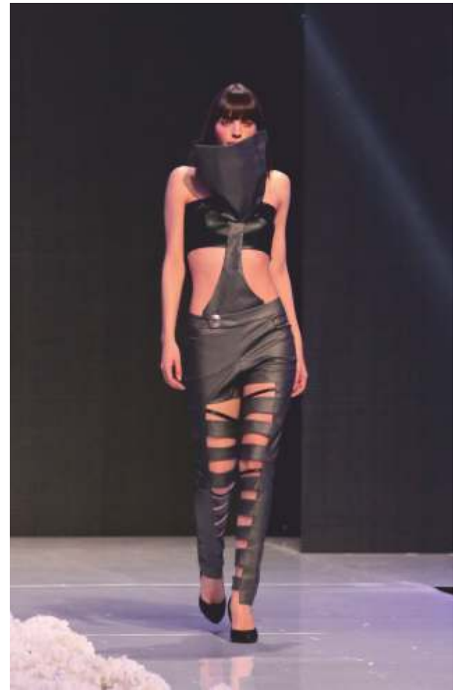
От колекция „Изгубени”