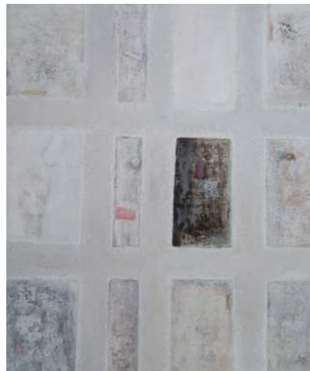
„Прозорци”, м.б., 55x46 см.

Завършила ЮЗУ „Н. Рилски” – Благоевград, спец. Живопис. Работи в областта на живописта, теорията и методиката на обучението по живопис.