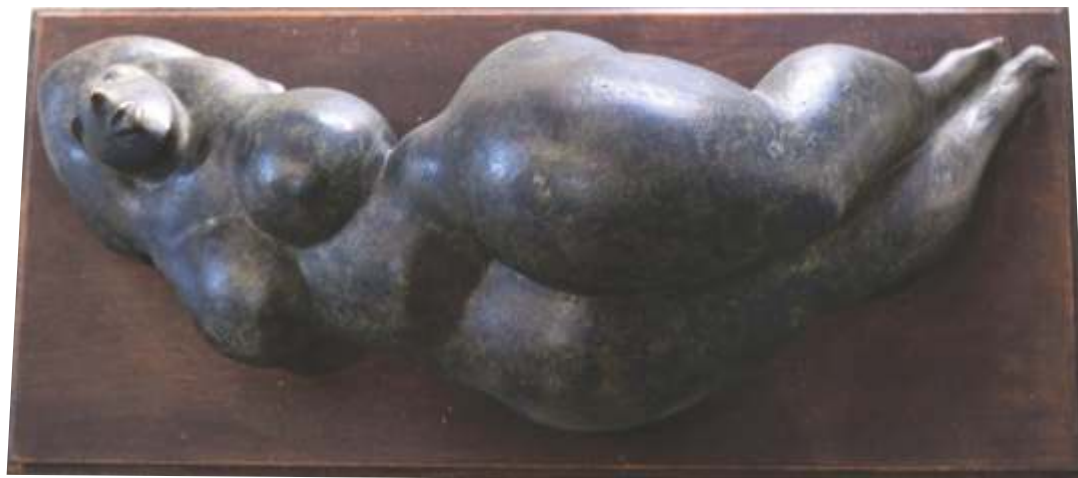
„Легнала фигура“ керамика, 15x56x27 см.