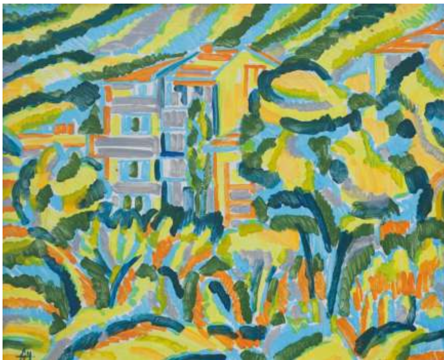
„Къща в жълто“ см. техника, 42x52 см.