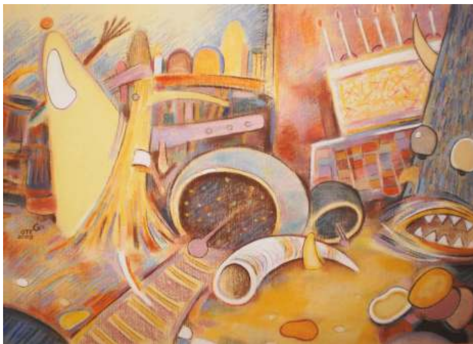
„Усещане за празник“ сух пастел, 50x70 см.

Работи в областта на графиката, графичния дизайн и рисунката.