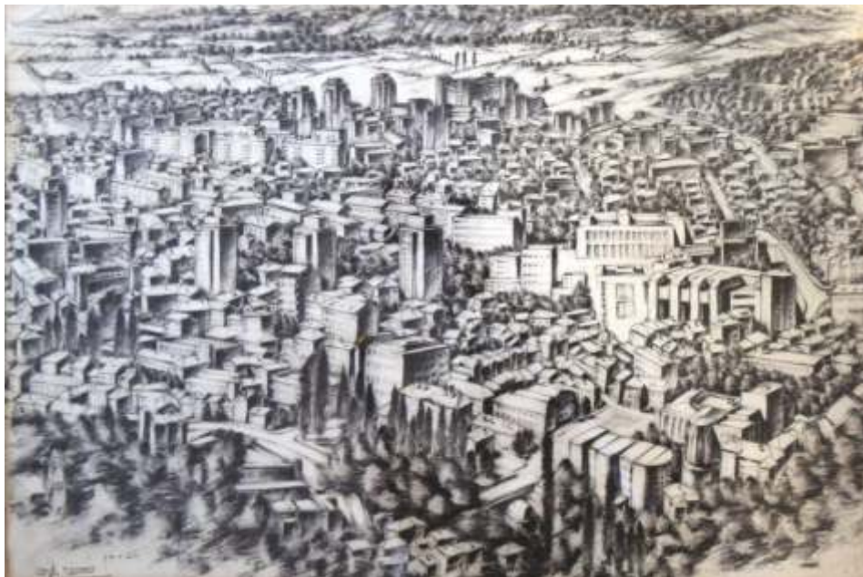
„Пейзаж от Благоевград“ рисунка, молив 50x35 см.

Завършил НХА – София, спец. Живопис. Работил в областта на живописта и рисунката.