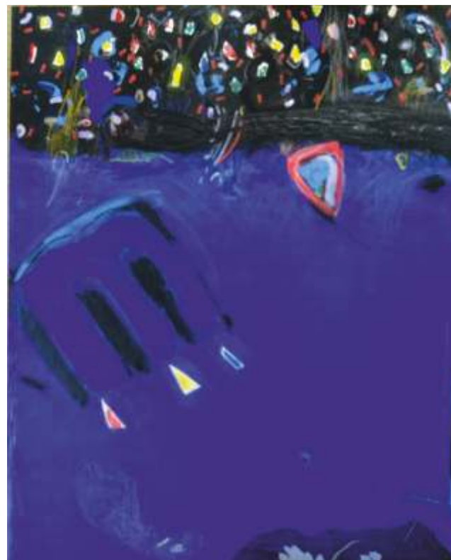
„Композиция Ш“ см. техника, 100x70 см.