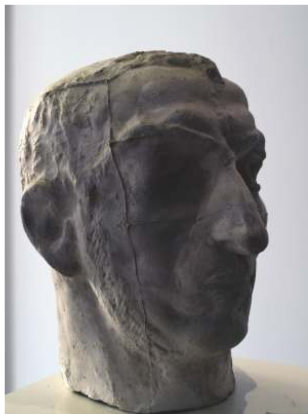
„Автопортрет“ камък, 43x27x35 см.