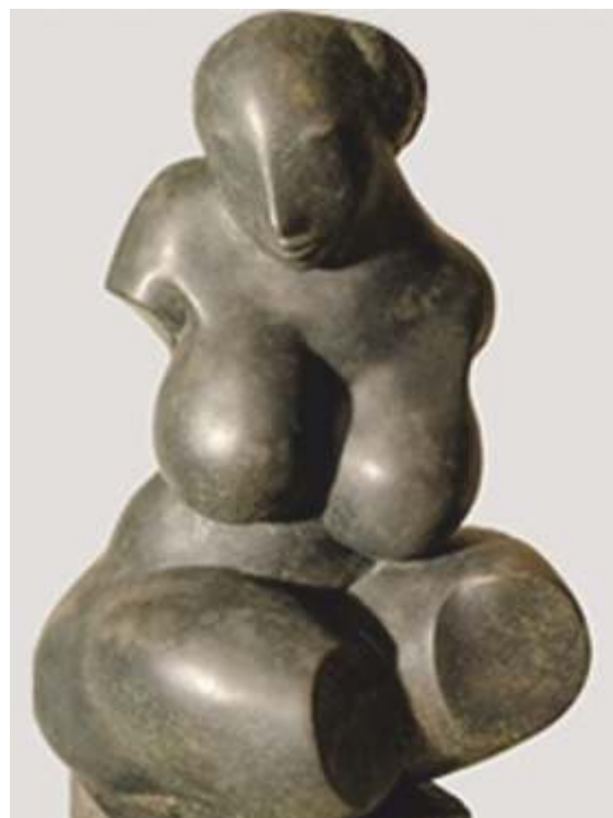
„Фигура“ керамика, 55x25x20 см.

Завършил спец. Керамика в НХА – София. Работи в областта на декоративните изкуства, керамиката и живописа.