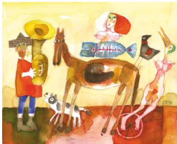
„В цирка“ рисунка, акварел 35x45 см.

Завършил в НХА – София, спец. Илюстрация. Работил в областта на илюстрацията, изкуството на книгата, рисунката, композицията, графиката, акварела, монументалните изкуства.