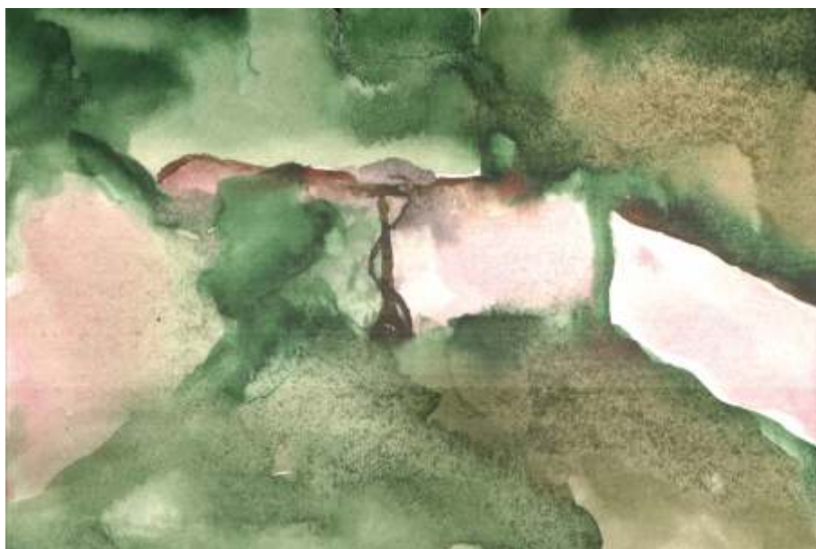
„Селски дувар“ акварел, 35x54 см.