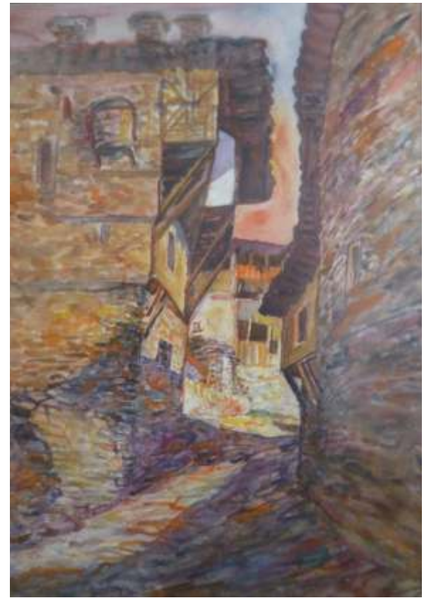
„Стари къщи“ акварел, 70x50 см.