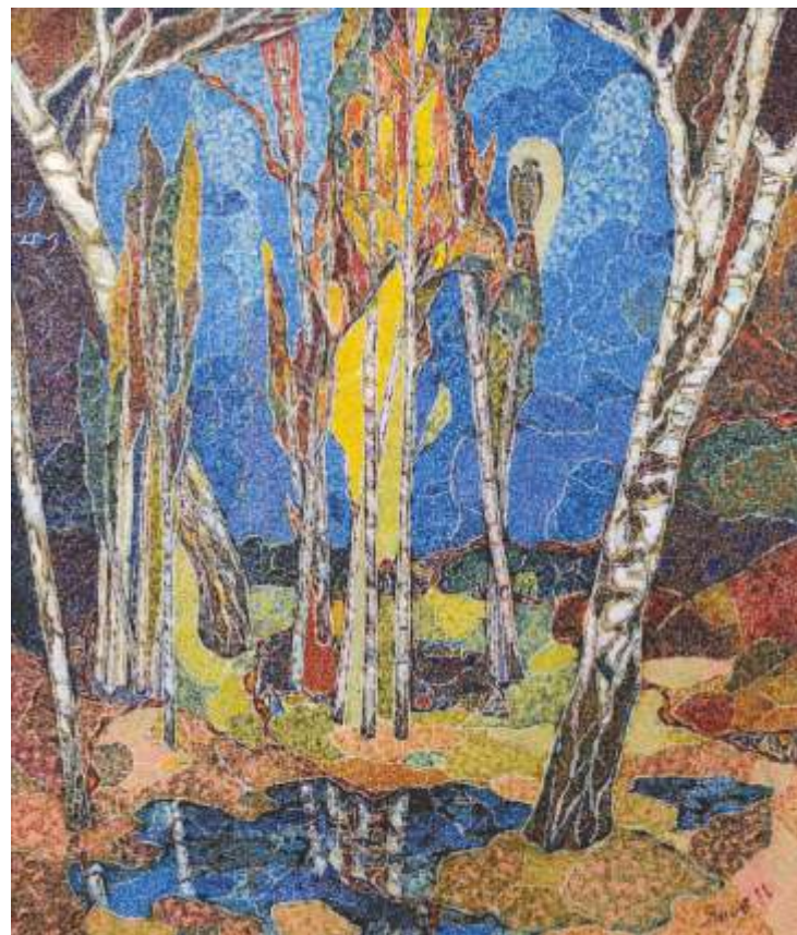
„Пейзаж“ м.б., 45x65 см.

Завършил в Санкт Петербург, спец. Художествено стъкло. Работи в областта на живописта и витража.