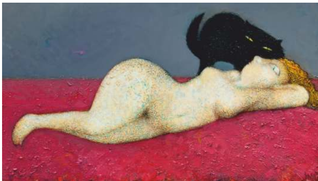
„Олимпия“ м.б., 43x79 см.