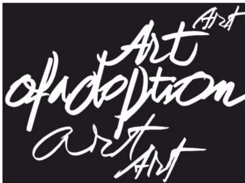
Шрифтово табло 90x90 см.

Завършил спец. Илюстрация в НХА – София. Работил в областта на шрифта, графичния дизайн, изкуството на книгата, илюстрацията и декоративните изкуства.