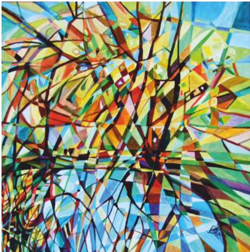
„Водно огледало“ акрил върху платно 80x80 см.

Завършила НХА – София, спец. Текстил. Работи в областта на модата и живописата.