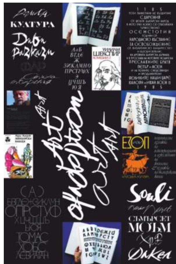
Проекти за корици и шрифтови табла