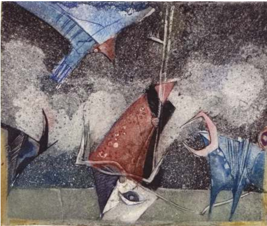
„Среднощни гости“ акватинта, 25x25 см.

Завършил спец. Графика в НХА – София. Работи в областта на всички жанрове и техники на кавалетната графика, компютърната графика и рисунката.