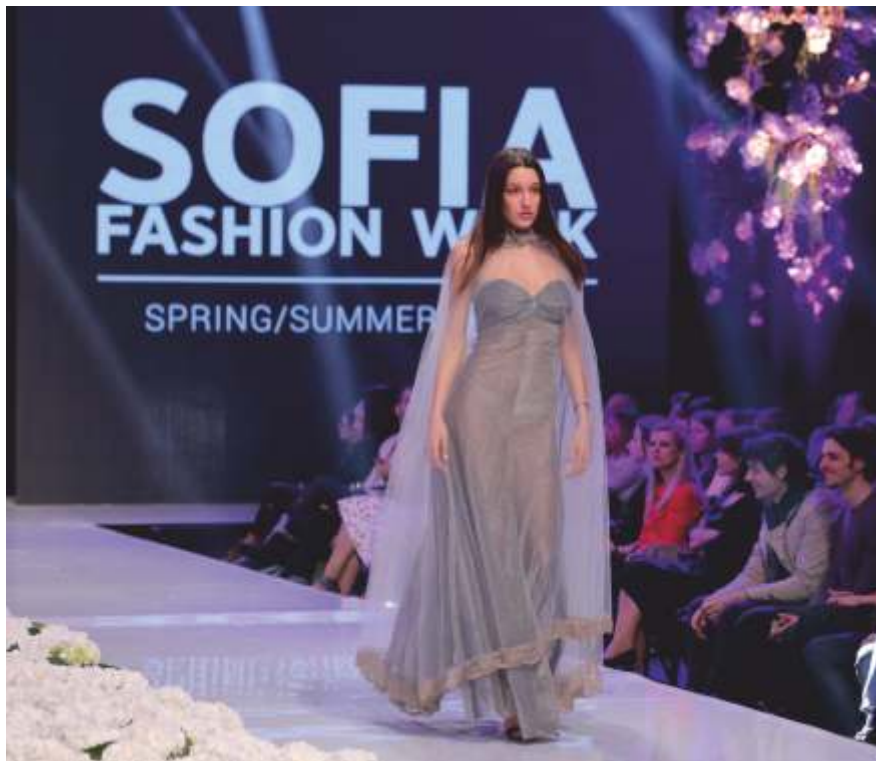
От колекция „Мъгла в нюанси”

Завършила ЮЗУ „Н. Рилски” – Благоевград. Работи в областта на модния дизайн.