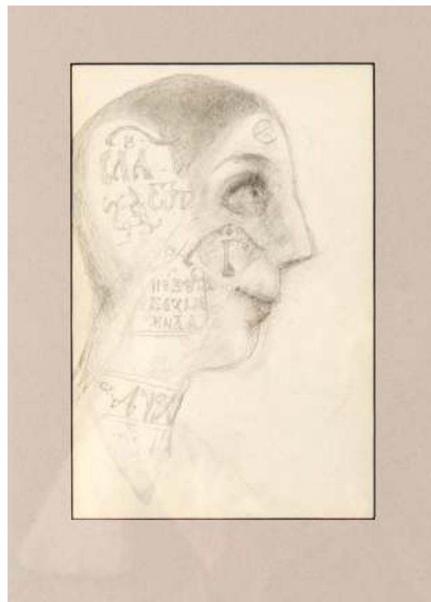
„Глава в профил“ молив, хартия, 24x18 см.