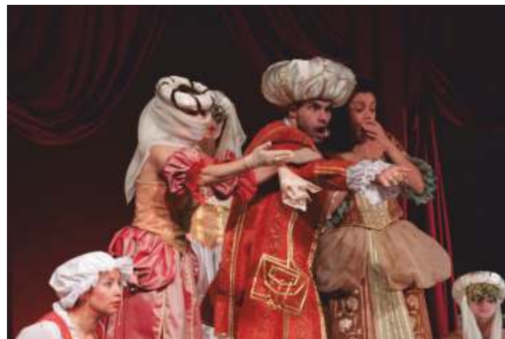
Костюми към „Безумният Жорден“ постановка на Софийска опера и балет

Завършва НХА – София, специализира "Костюмът в модата и сценичните изкуства"- 2001, Париж. Работи в областта на живописта и модния дизайн. Последният художествен директор на ЦНСМ.