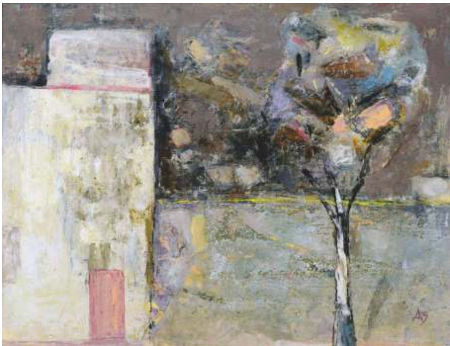
„Улица” м.б., 50x70 см.