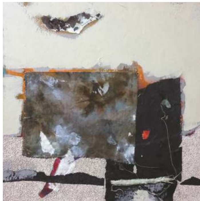
„Композиция“ см. техника, 50x50 см.

Завършил ЮЗУ „Н. Рилски“ – Благоевград. Работи в областта на рисунката, живописа и графиката.