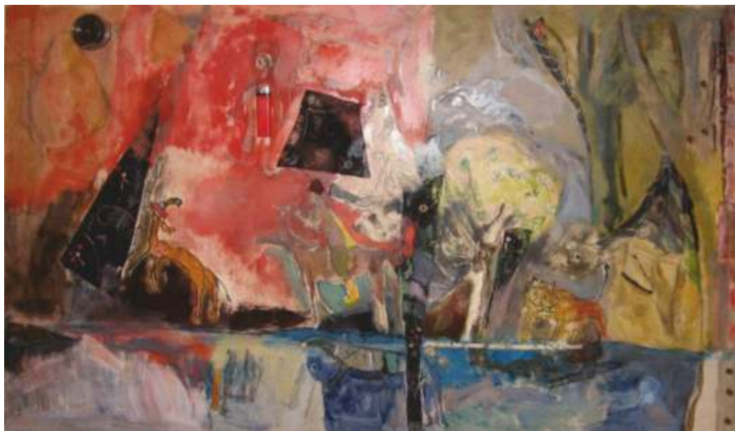
„Градината на Аллаха” см. техника, 120x80 см.