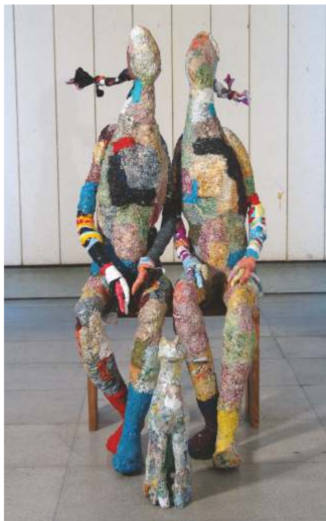
„1, 2 и 3“ см. техника 150x60x80 см.