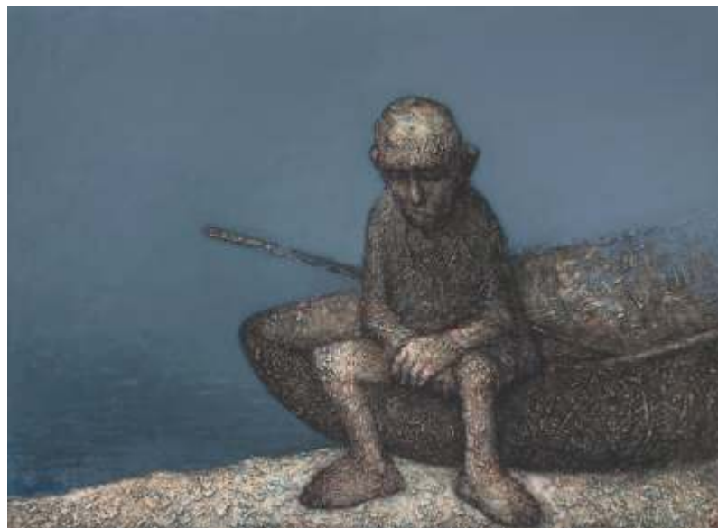
„Тишина“ м.б., 68x93 см.

Завършил в НХА – София, спец. Илюстрация. Работи в областта на илюстрацията, живописа, акварела и графиката.