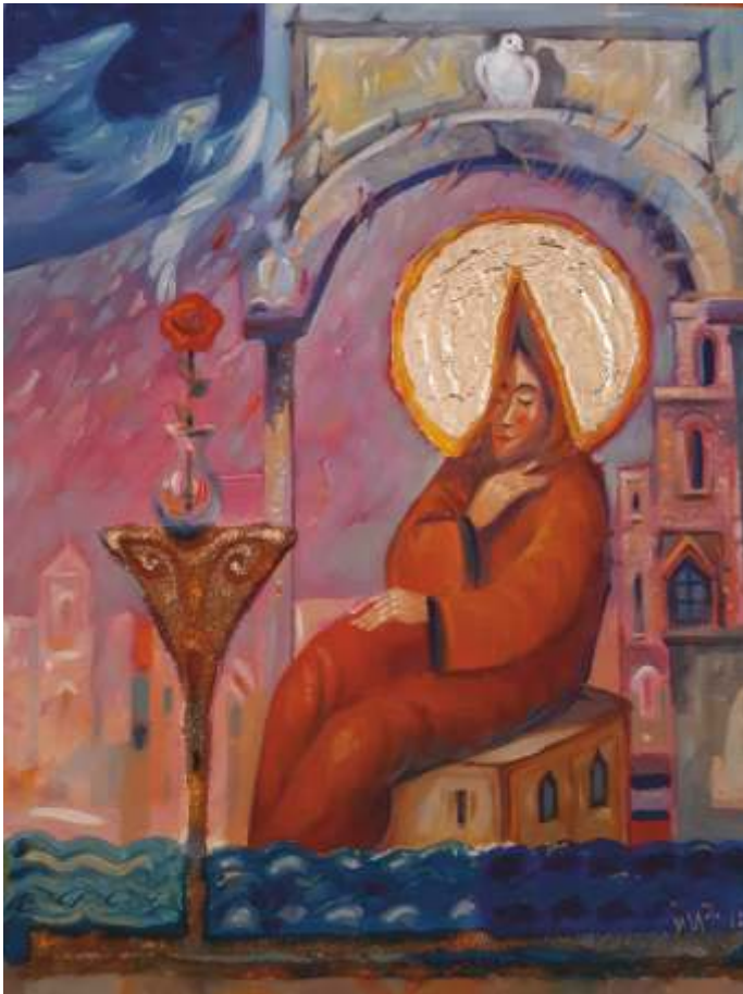
„Благовещение“ м.б., платно, 35x25 см.

Завършил ЮЗУ „Н. Рилски” – Благоевград. Работи в областта на графиката и рисунката.