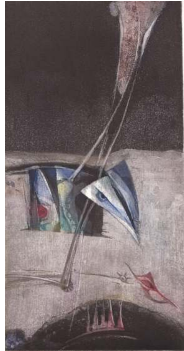
„Забравени от вятъра“ акватинта, 30x15 см.