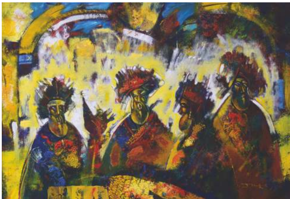
„Храм“ см. техника, 50x70 см.