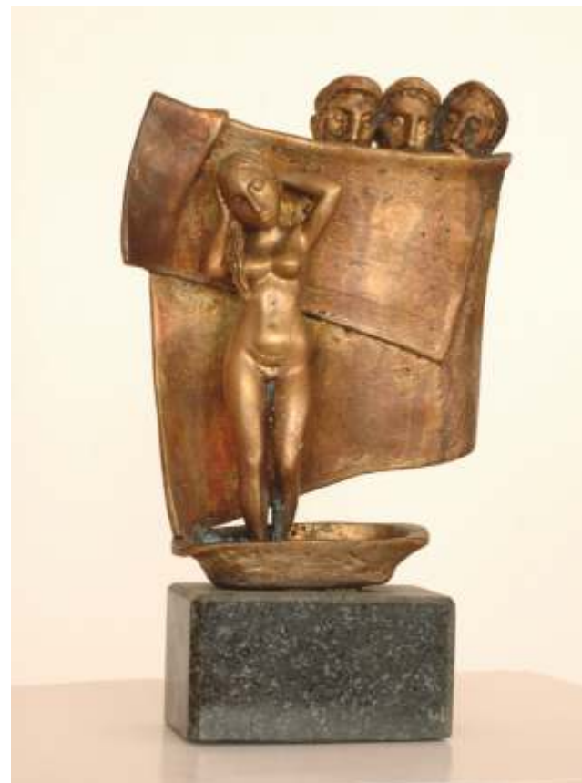
„Тоалет“ бронз, 41x27x12 см.