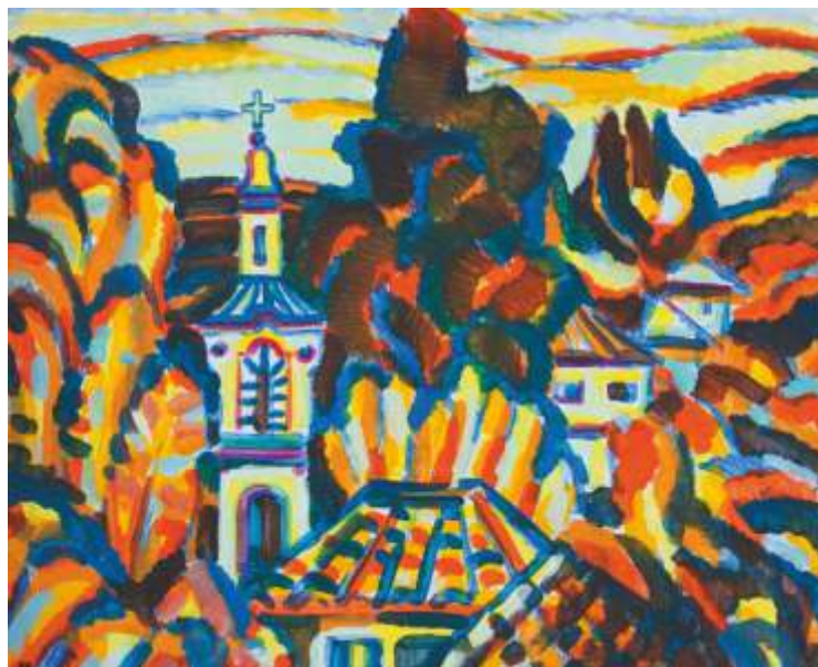
„Черква във Вароша“ м.б., 90x100 см.

Завършил в НХА – София, спец. Живопис. Работи в областта на педагогиката на изобразителното изкуство и живописата.