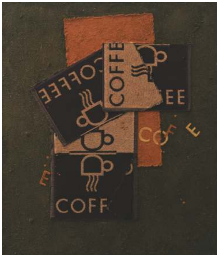
„Полюси” см. техника, метал, предмети 120x100 см.

Завършил НХА – София, спец. Живопис. Работи в различните жанрове на живописа и нестандартните изкуства.