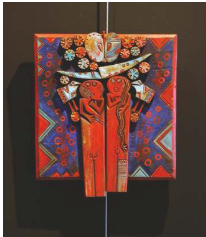
„Память I” оцветено дърво, 100x80 см.